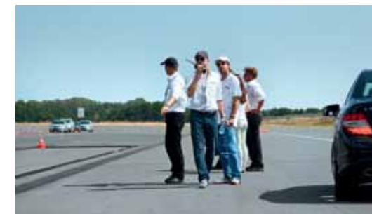
Опытные тренеры будут сопровождать Вас на протяжении всего тренинга.

Решить на месте все дополнительные вопросы и выполнить Ваши просьбы до, после и во время проведения мероприятия Вам всегда поможет наша команда организаторов.