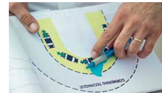
Как положено: профессиональный инструктаж перед каждым упражнением.