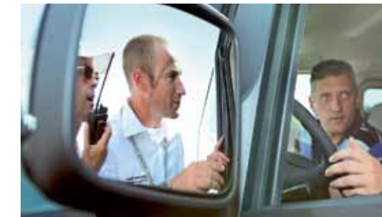
Команда Академии вождения окажет Вам всестороннюю поддержку.